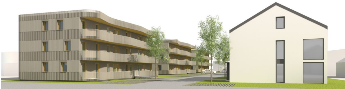
Bebauung aus der Perspektive vom Riedweg | Quelle: andOffice / HTS Handels GmbH

Zur weiteren Entlastung des Mietwohnungsmarktes plant die Stadt zusammen mit der Hoffnungsträger Stiftung die Bebauung des ca. 0,62 ha großen Areals neben dem Friedhof, zwischen Steinenbacher Weg und Riedweg.